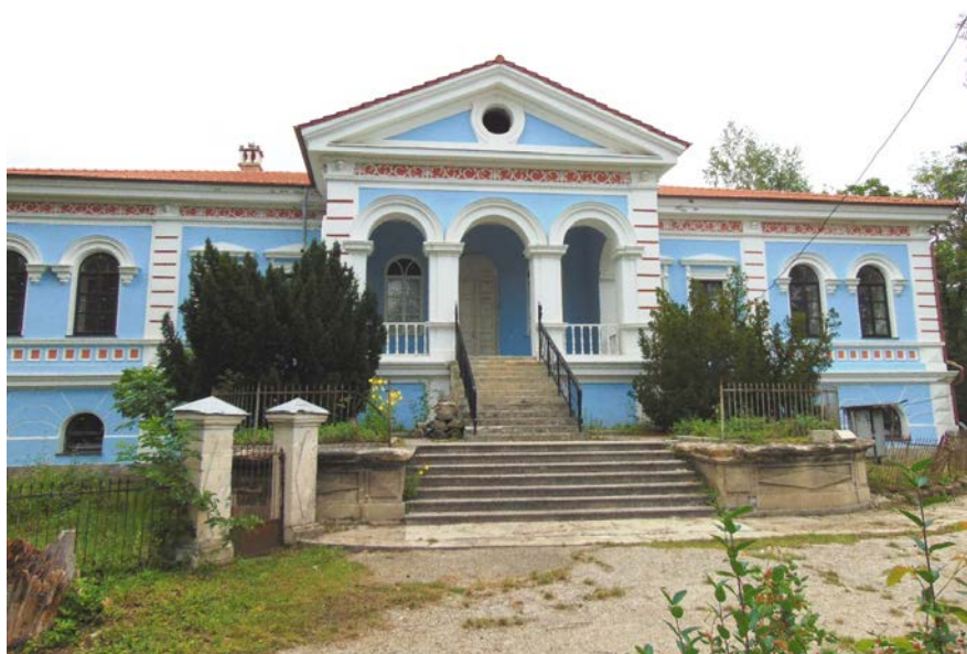
Приложение № 2 Барельеф Карапета Балиоза на центральном здании усадьбы